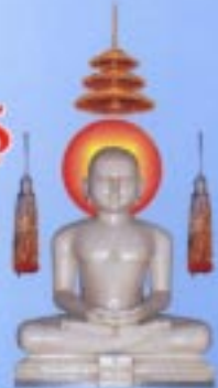
વિદેહીનાથ શ્રી સીમંપરસ્વામી