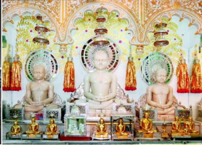
શ્રી શાન્તિનાથ ભગવાન