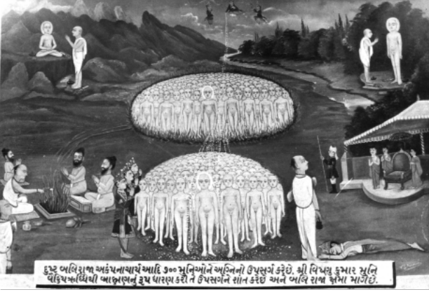
દુષ્ટ બલિરાજ અકંપનાચાર્ય આદિ ૩૦૦ મુનિઓને અગ્નિની ઉપસંગ કરે છે. શ્રી વિષ્ણુ કુમાર મુનિ પશ્ચિમવર્ધિથી આક્રમણનું રૂપ પારણ કરી તે ઉપસંગને સાન કરે છે અને બલિ રાજા જેમા મારે છે.

અવન્તી દેશમાં ઉજ્જયિનીમાં શ્રીવર્મા રાજા હતો. તેને બલિ, બૃહસ્પતિ, પ્રહ્લાદ અને નમુચિ એ ચાર મંત્રીઓ હતા. ત્યાં એક દિવસ સમસ્ત શ્રુતના ધારી દિવ્યજ્ઞાની અકમ્પનાચાર્ય સાતસો મુનિઓ સહિત આવીને બગીચામાં રહ્યા.