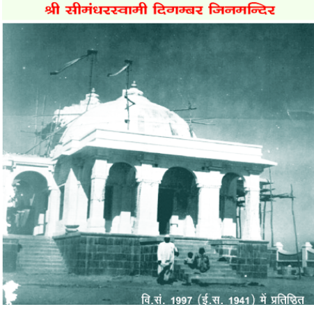
શ્રી સીમંધરસ્વામી દિગમ્બર જિનમંદિર