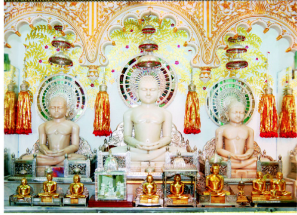
શ્રી શાન્તિનાથ ભગવાન