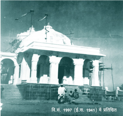
વિ.સં. ૧૯૯૭ (ઈ.સ. ૧૯૪૧) મેં પ્રતિષ્ઠિત