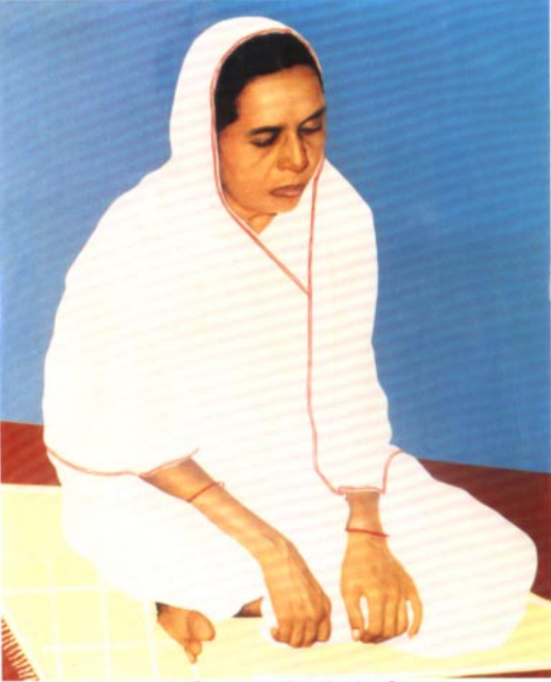
प्रशममूर्ति पूज्य गढेनश्री चंपाडेन

श्री दिगंबर जैन स्वाध्यायमंदिर ट्रस्ट, सोनगढ - 364250