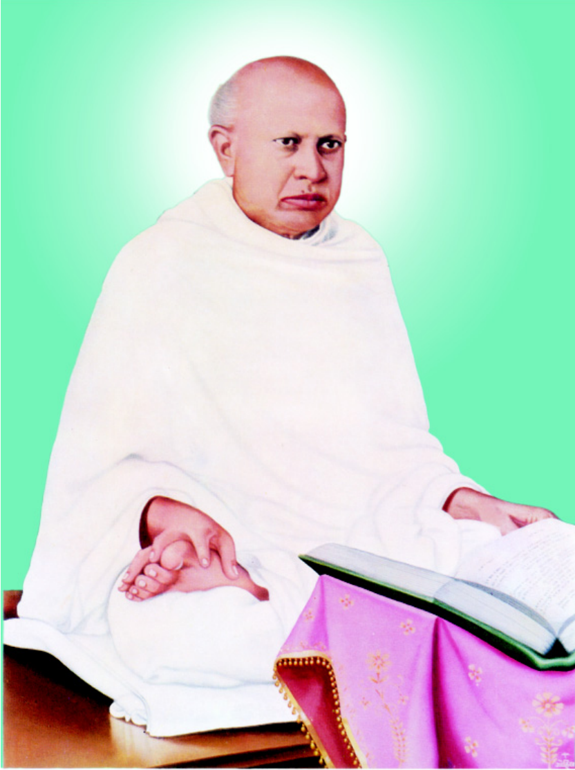
परम पूज्य अध्यात्ममूर्ति सद्गुरुदेव श्री कानजुस्वामी